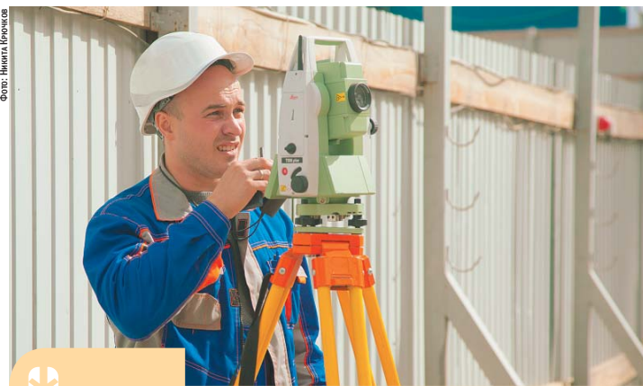
За первое полугодие 2015 года объемы инженерных изысканий снизились на 20%

По данным Росстата, за 2014 год объем инженерных изысканий сократился более чем в два раза. А за первое полугодие 2015 года, как свидетельствует анализ загрузки такого крупного участника рынка, как ОАО «Трест ГРИИ», объемы инженерных изысканий снизились более чем на 20% по отношению к январю-июлю прошлого года. Однако существенного падения цен при этом не произошло.